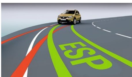
Система курсовой устойчивости ESP с функцией анти-опрокидывания ROM