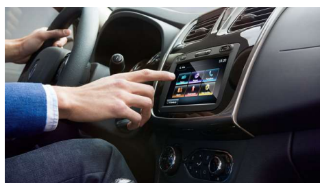
Мультимедийная система Media NAV Evolution с сенсорным экраном, навигацией и Bluetooth