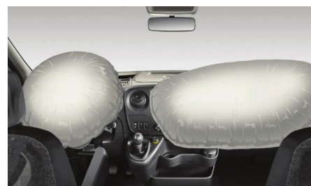
Современные системы пассивной безопасности, позволят чувствовать себя уверенно в любых ситуациях