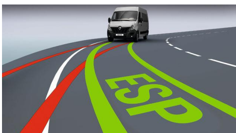
ESP с системой помощи при трогании в гору Hill Start Assist являются стандартным оснащением