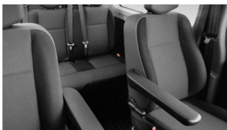
9-местный вместительный салон