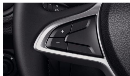
Круиз-контроль (ограничитель скорости)