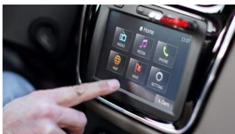
Мультимедийная система Media Nav с сенсорным экраном, навигацией и Bluetooth