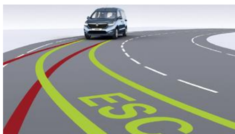
Система курсовой устойчивости ESP